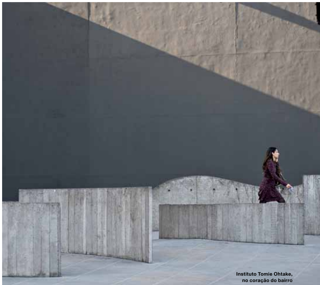
Instituto Tomie Ohtake, no coração do bairro

Com o maior índice de aprovação de moradores de toda a capital segundo o Ibope, a região troca de roupa sem perder as vantagens já adquiridas. Fica próxima da maior universidade do Brasil e sedia o renomado Hospital das Clínicas. É o lugar perfeito para quem quer morar próximo ao local de trabalho, com fácil acesso às marginais e ao centro. Tudo isso com qualidade de vida: parques, praças, escolas de alto nível e shoppings atraem visitantes da cidade inteira. Viver em Pinheiros é um privilégio. Não é preciso caminhar mais do que algumas quadras para encontrar o que São Paulo pode oferecer de melhor.