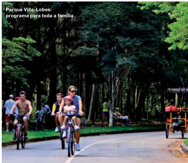
Parque Villa-Lobos: programa para toda a família

IMPRESSÃO EFEITO GRAPH. ESTE GUIA FOI IMPRESSO EM PAPEL COUCHÉ 150 G/M 2 (MIOLO) E 230 G/M 2 (CAPA). TIRAGEM 2.000 EXEMPLARES. TODOS OS DIREITOS RESERVADOS. PROIBIDA A REPRODUÇÃO SEM AUTORIZAÇÃO PRÉVIA E ESCRITA. TODAS AS INFORMAÇÕES TÉCNICAS SÃO DE RESPONSABILIDADE DOS RESPECTIVOS AUTORES. PUBLICADO EM JANEIRO DE 2011.