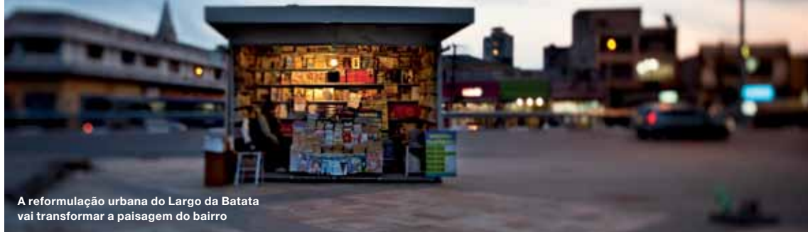
A reformulação urbana do Largo da Batata vai transformar a paisagem do bairro

COM O LARGO DA BATATA REVITALIZADO E DUAS NOVAS LINHAS DE METRÔ, A ÁREA CENTRAL DE PINHEIROS GANHA UM NOVO PERFIL