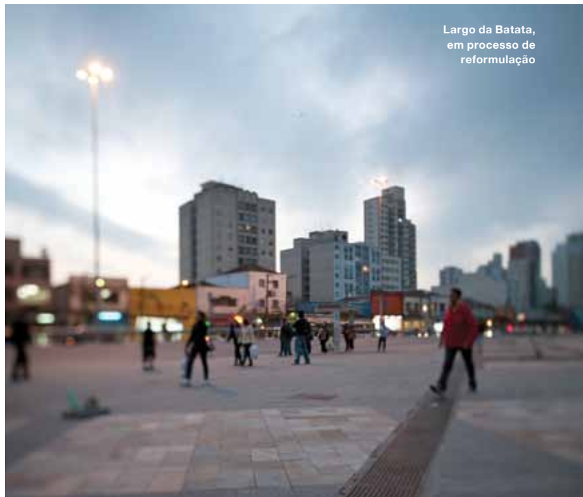
Largo da Batata, em processo de reformulação

A terceira etapa da evolução de Pinheiros foi marcada pelo crescimento acelerado, com linhas de bondes chegando até suas ruas. Os bairros movimentados ao redor causariam impacto nos anos 1960, quando a população de Pinheiros chegou a 47 mil habitantes. Na década de 1980, esse número subiu para 77 mil e já chegou a 94 mil hoje, mas a expectativa é de que aumente mais com a atual configuração do bairro.