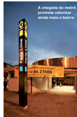
A chegada do metrô promete valorizar ainda mais o bairro

O perfil do morador do bairro se enquadra em dados de países desenvolvidos. Pinheiros tem 12,8 leitos hospitalares por mil habitantes, contra 3,11 em média da capital. A taxa de homicídios é de 1,93 por 100 mil habitantes – em São Paulo, são 11,7 perante o mesmo grupo. A região tem 14% de moradores da classe A e 7% cujas características se encaixam na classe B, os maiores percentuais da cidade. Por tudo isso, os imóveis da região valorizaram 63% nos últimos 10 anos. Só em 2010 foram inauguradas 475 novas unidades residenciais – número que deve aumentar com a chegada das novas linhas de metrô.