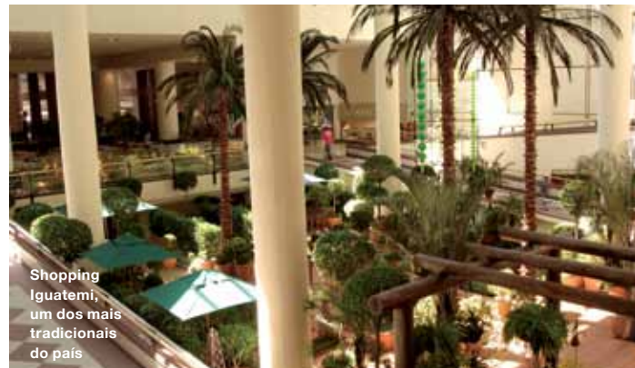
Shopping Iguatemi, um dos mais tradicionais do país