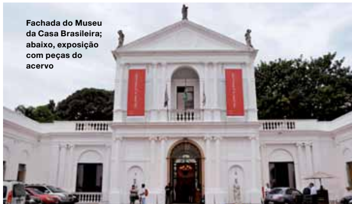
Fachada do Museu da Casa Brasileira; abaixo, exposição com peças do acervo