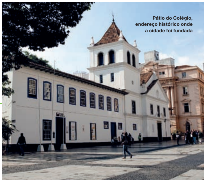
Pátio do Colégio, endereço histórico onde a cidade foi fundada

importante movimento artístico do Brasil, a Semana de Arte Moderna de 1922. Até a década de 1960, o Centro foi o principal reduto financeiro do país, até que importantes empresas mudaram suas sedes para outros bairros. Mas a principal, a bolsa livre – a atual BM&FBOVESPA –, permanece ali até hoje.