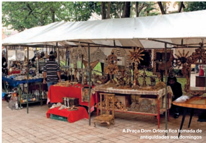
A Praça Dom Orione fica tomada de antiguidades aos domingos

Seja pelas cantinas pitorescas ou pela simpática feira de domingo, o bairro italiano é um passeio imperdível