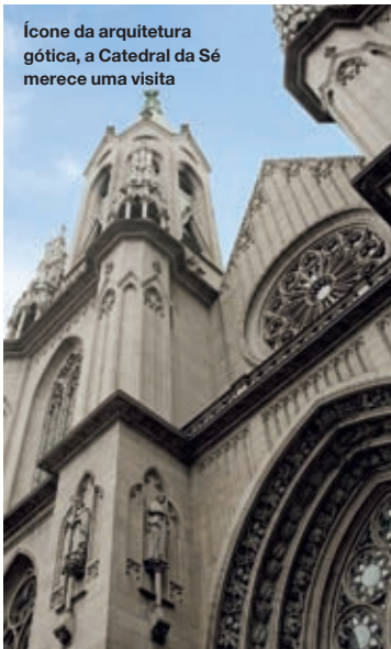
Ícone da arquitetura gótica, a Catedral da Sé merece uma visita

A região concentra alguns dos mais belos cartões postais da cidade, como a Catedral da Sé , o Mosteiro de São Bento e o Teatro Municipal. Esses locais foram restaurados, preservados e fazem parte não só da história de São Paulo como do país. É o caso do Mosteiro de São Bento (Largo São Bento, s/nº, tel. 3328-8799, www.mosteiro.org.br ), cuja basílica é de 1634. A construção atual, erguida no período de 1910 a 1922, foi inspirada na tradição eclética germânica e passou por uma restauração em 2006 para hospedar o Papa Bento XVI durante sua visita ao Brasil no ano seguinte. Além da Basílica de Nossa Senhora da Assunção, o mosteiro abriga o colégio e a Faculdade de São Bento. Os monges também moram no local ( leia mais em Diversão & Arte/Escolas e Universidades ).