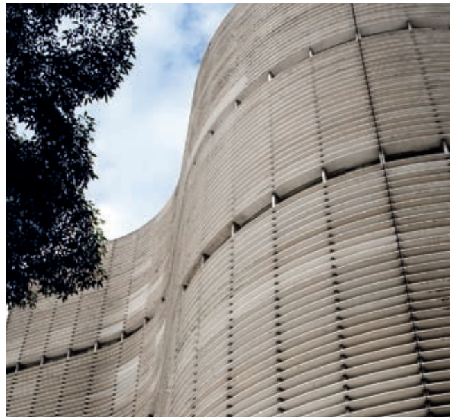
Copan: curvas de concreto de Oscar Niemeyer