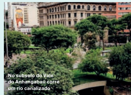
No subsolo do Vale do Anhangabaú corre um rio canalizado

O Vale do Anhangabaú fica entre os dois principais viadutos da região, o do Chá e o Santa Ifigênia, e separa o Centro velho do Centro novo. No subsolo, corre o rio Anhangabaú, de grande importância para a história da cidade, e hoje canalizado. Possui jardins, esculturas e chafarizes.