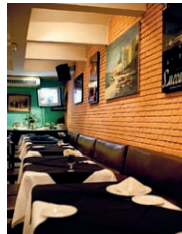
Inaugurado em 1881, o Carlino é o restaurante mais antigo em funcionamento na cidade

Pesados investimentos financeiros da iniciativa privada e pública em projetos de revitalização aproximam o sonho de ver o Centro se transformar em um polo de atração turística e cultural, seguro e limpo. O plano começou tímido, em 1990. Hoje,