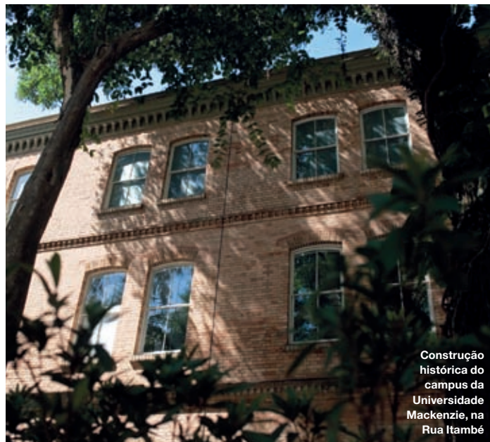
Construção histórica do campus da Universidade Mackenzie, na Rua Itambé

instituições de ensino superior de prestígio da cidade de São Paulo, como a Universidade Mackenzie , a Faculdade de Direito do Largo São Francisco, a Fundação Escola de Comércio Álvares Penteado (Fecap), além de importantes colégios, como o São Bento e o Liceu. Veja mais em Escolas & Universidades.