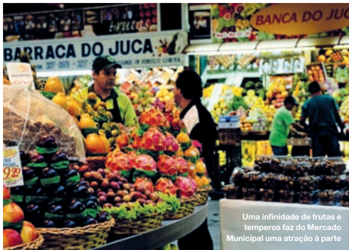
Uma infinidade de frutas e temperos faz do Mercado Municipal uma atração à parte