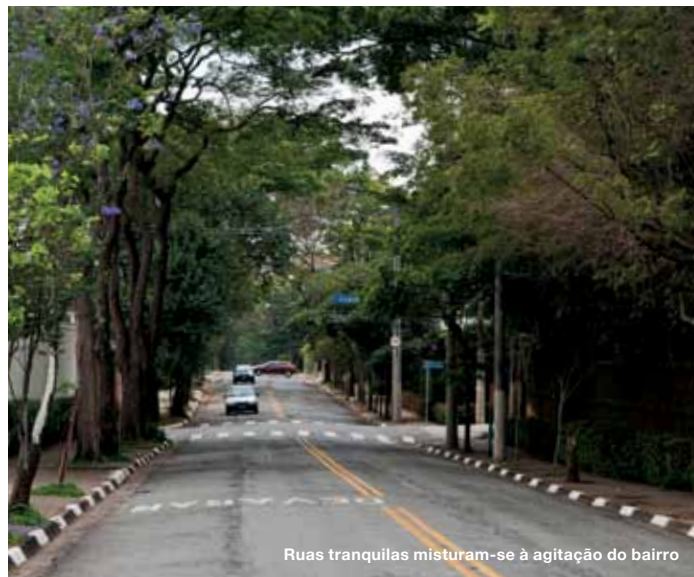
Ruas tranquilas misturam-se à agitação do bairro

CAPA FOTO: GABRIEL CAPPELLETTI. IMPRESSÃO LEOGRAF - GRÁFICA E EDITORA LTDA. ESTE GUIA FOI IMPRESSO EM PAPEL COUCHÉ 150 G/M 2 (MIOLÓ) E 230 G/M 2 (CAPA). TIRAGEM 2 MIL EXEMPLARES. TODOS OS DIREITOS RESERVADOS. PROIBIDA A REPRODUÇÃO SEM AUTORIZAÇÃO PRÉVIA E ESCRITA. TODAS AS INFORMAÇÕES TÉCNICAS SÃO DE RESPONSABILIDADE DOS RESPECTIVOS AUTORES. PUBLICADO EM NOVEMBRO DE 2011.