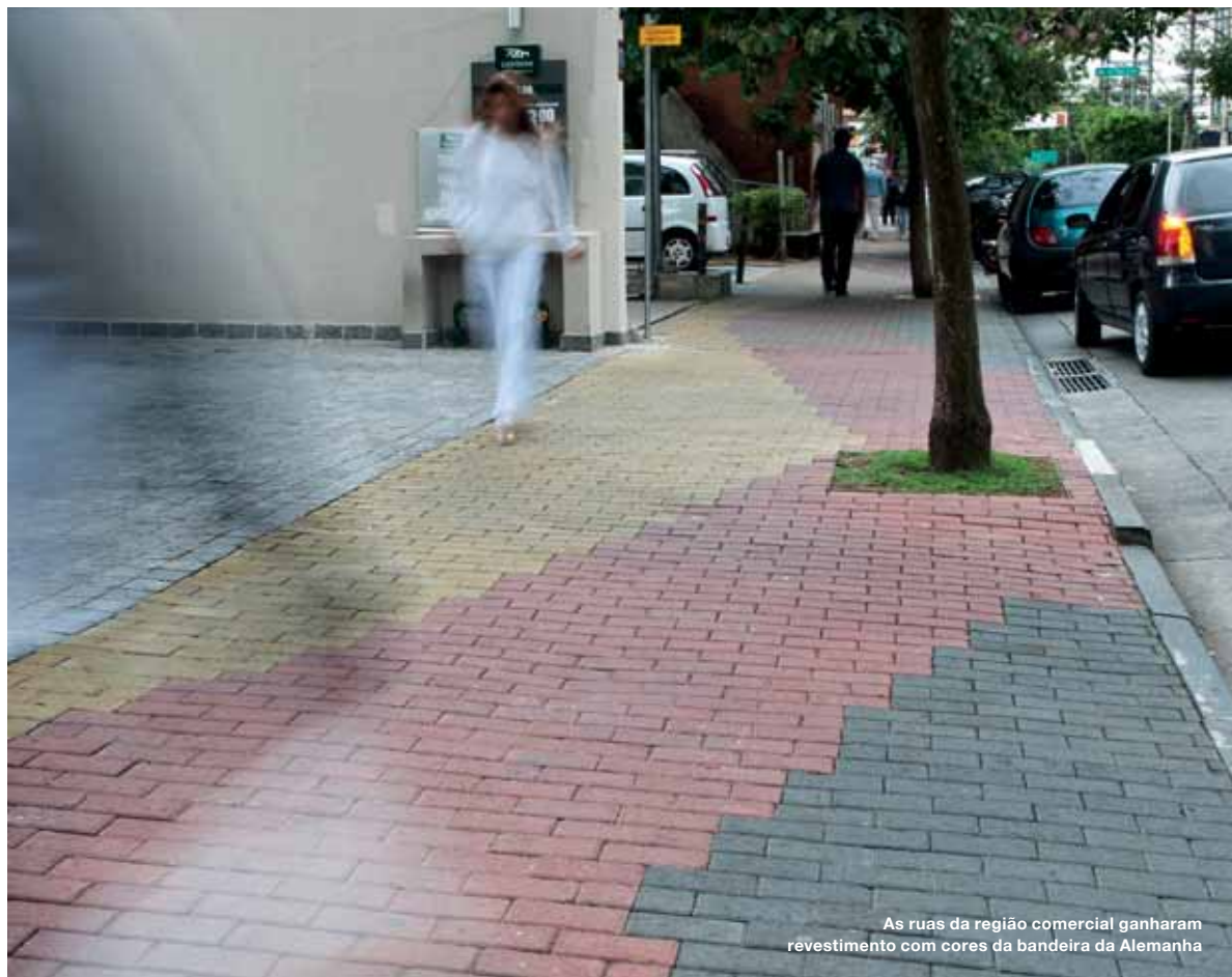
As ruas da região comercial ganharam revestimento com cores da bandeira da Alemanha

Organizada pela Associação dos Empreendedores e Moradores do Brooklin (AEMB), a tradicional Maifest é a principal manifestação cultural germânica do bairro. Todos os anos, as ruas restauradas são ocupadas por essa grande festa que recebe 100 mil pessoas, com comida alemã e brasileira, apresentações musicais e artesanato.