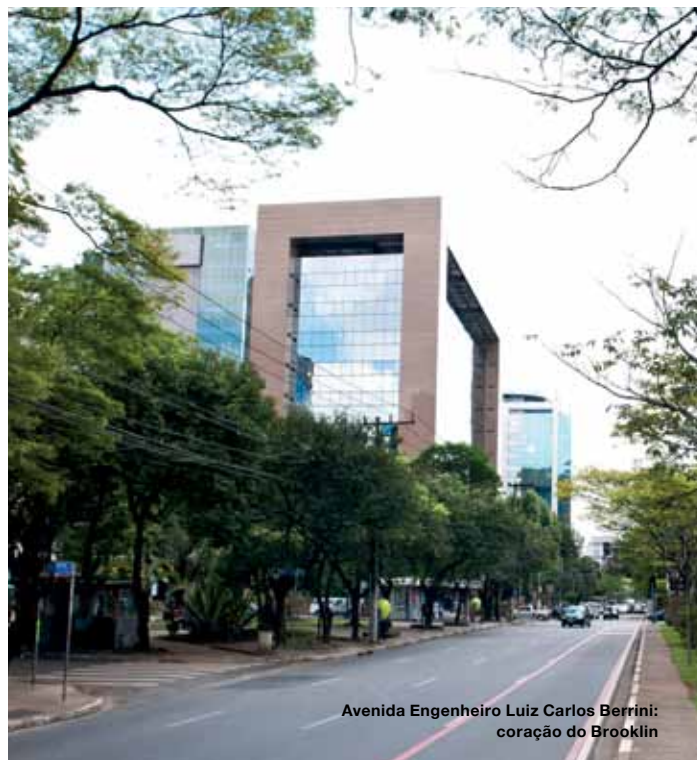
Avenida Engenheiro Luiz Carlos Berrini: coração do Brooklin

A partir dos anos 1960, a região industrial passou a ser valorizada por quem buscava tranquilidade e segurança. O chamado Brooklin Velho, delimitado pelas avenidas Professor Vicente Rao, Santo Amaro, Jornalista Roberto Marinho e Washington Luís, se tornou destino de empreendimentos residenciais. Já o Brooklin Novo passou a abrigar escritórios de multinacionais. A proposta de definir um novo eixo financeiro como uma alternativa à Avenida Paulista foi concretizada no início dos anos 1970 com a construção da Avenida Engenheiro Luiz Carlos Berrini, entre o Brooklin e a Vila Olímpia. Rapidamente, a via passou a ser composta por uma série de prédios comerciais.