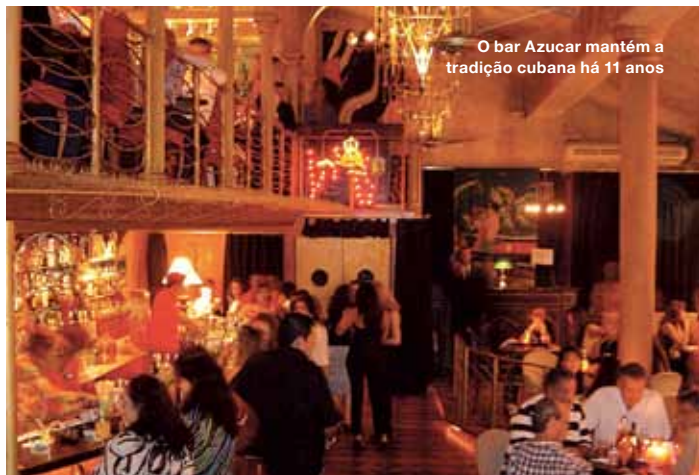
O bar Azucar mantém a tradição cubana há 11 anos