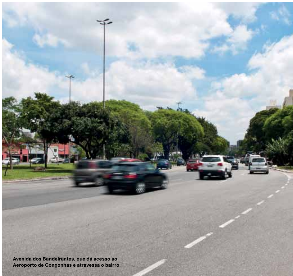
Avenida dos Bandeirantes, que dá acesso ao Aeroporto de Congonhas e atravessa o bairro