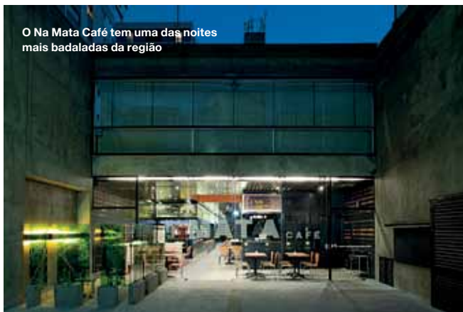
O Na Mata Café tem uma das noites mais badaladas da região