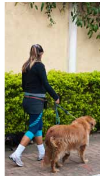
Número de cães por habitante no Brooklin é um dos maiores da cidade

Ir ao banco, ao supermercado e até fazer compras sem usar o carro é um luxo disponível aos moradores do Brooklin. A farta disponibilidade de serviços e lojas no bairro, aliados ao desenho plano das ruas, são um convite irresistível às caminhadas diárias – nem que seja apenas para dar uma volta no quarteirão ou levar o cachorro para passear. Especialmente aos fins de semana, quando a agitação dos escritórios dá uma trégua, também é comum ver famílias inteiras andando de bicicleta pelas ruas.